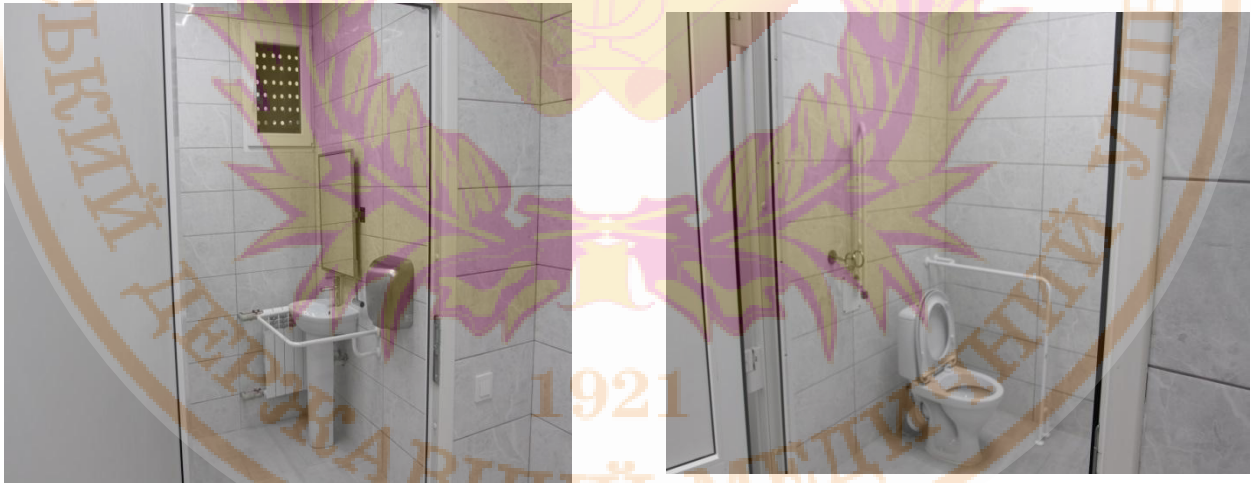
Туалет для осіб з особливими освітніми потребами

На території університету відведено місця для паркування авто осіб з особливими потребами. Прилегла до будівлі територія обладнана для комфортного пересування – наявні пішохідні доріжки мають рівне