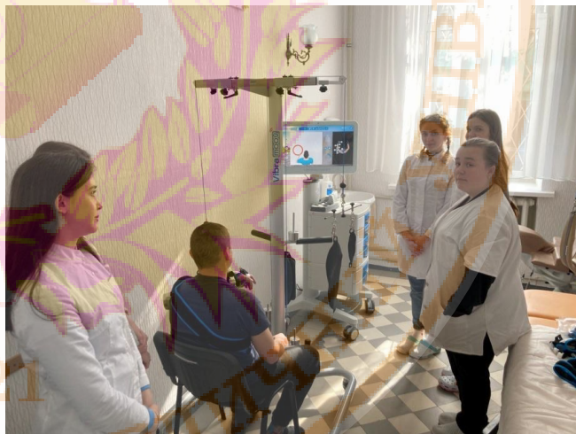
Матеріально-технічне забезпечення клінічних кафедр Університету

Соціальна реабілітація Центром ветеранського розвитку здійснюватиметься за двома напрямками: психологічна реабілітація ветеранів та членів їх сімей; підготовка та перепідготовка ветеранів з медичною освітою на циклах підвищення кваліфікації в Університеті.