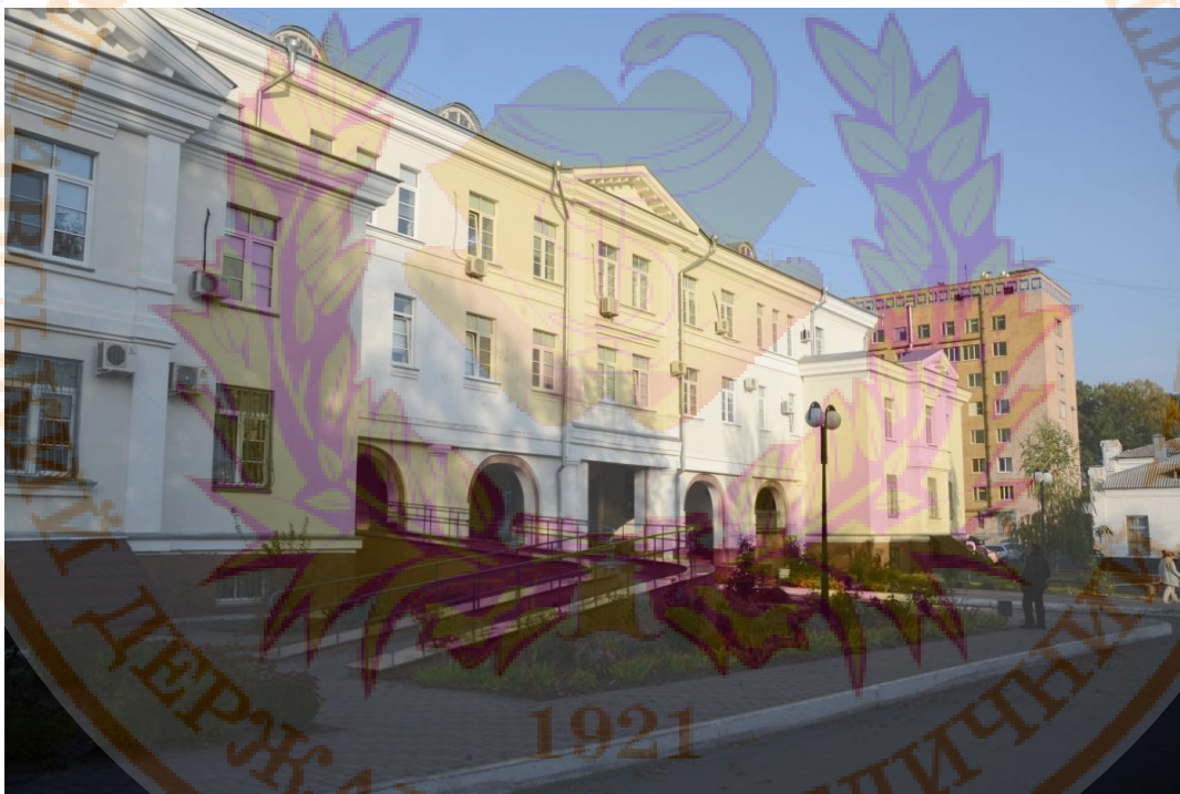
Хірургічний корпус КП «Полтавська обласна клінічна лікарня ім. М.В. Скліфосовського Полтавської обласної ради»

Заклади охорони здоров'я міста Полтави, які є клінічними базами кафедр, надали технічні звіти про доступність будівель для осіб з особливими потребами, що підтверджується листом ДОЗ Полтавської ОДА від 22.12.2021 №03/11.