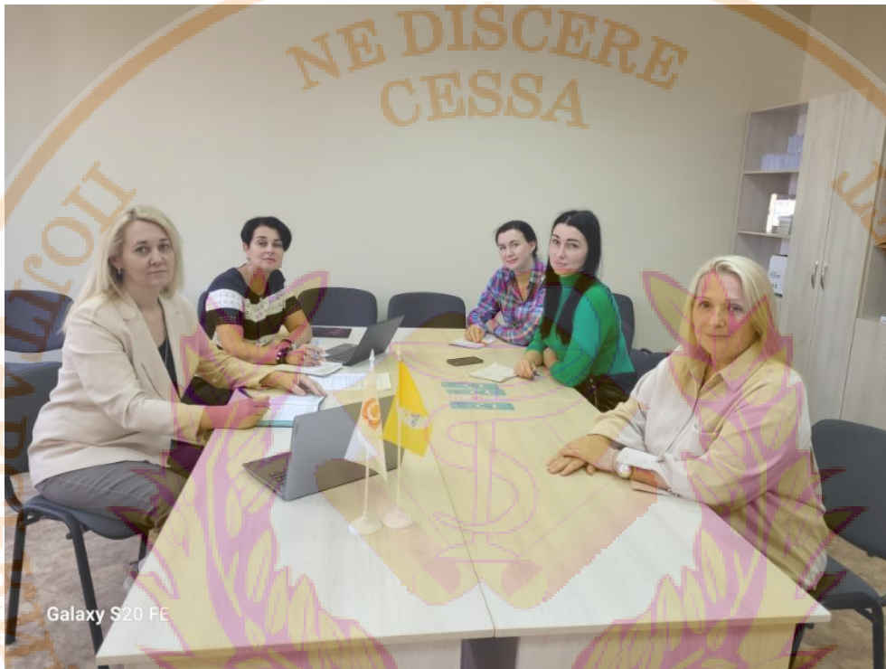
Навчально-науковий центр ментального здоров'я

Психологічна реабілітація та підтримка здійснюватиметься на базі кафедри психіатрії, наркології та медичної психології та на базі Центру ментального здоров'я Університету.