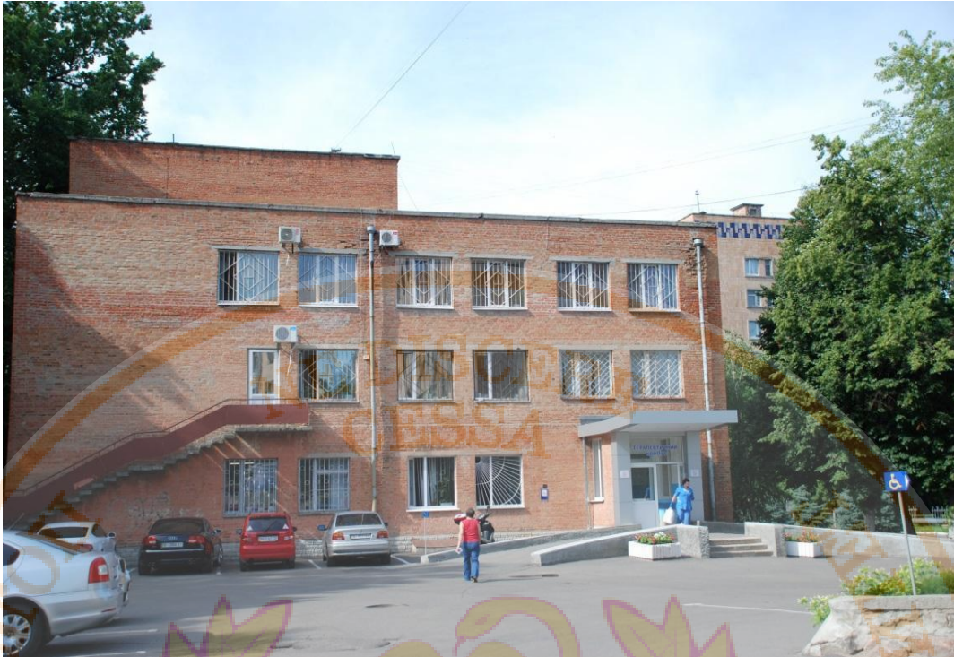
Терапевтичний корпус КП «Полтавська обласна клінічна лікарня ім. М.В. Скліфосовського Полтавської обласної ради»

На виконання постанови Кабінету Міністрів України від 30.12.2015 №1187 (із змінами і доповненнями, внесеними постановами Кабінету Міністрів України від 10.05.2018 №347, від 24.03.2021 №365) проектування, будівництво і реконструкція будівель, споруд і приміщень університету здійснюються з урахуванням потреб осіб з особливими освітніми потребами (ДБН В.2.2-401:2018 «Інклюзивність будівель та споруд»). Зокрема, територія прилегла до фасаду адміністративного корпусу за адресою вул. Шевченка, 23 не містить перешкод для руху мало мобільних груп населення, будівлю обладнано пандусами, зовнішні сходи доповнені розділовими поручнями, поручні розташовані з обох боків сходинок маршу, вестибюль головного корпусу доповнено освітленням, приміщення приймальної комісії доступні, є пристосований до потреб осіб з особливими потребами туалет спільного застосування, двері не містять порогів,