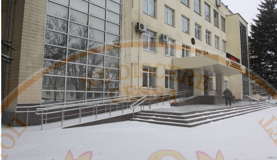
Вхід в адміністративний корпус Університету

обладнана територія для очікування, надаються послуги адміністратора. Біля входу до головного корпусу наявна контактна кнопка виклику чергового.