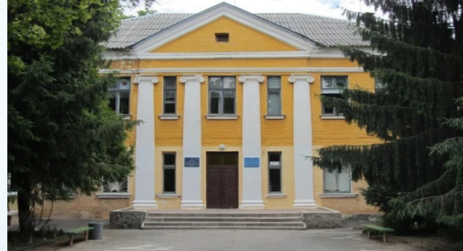
Центр спеціалізованої педіатричної допомоги КП «ПОКЛ» ім. М.В. Скліфосовського