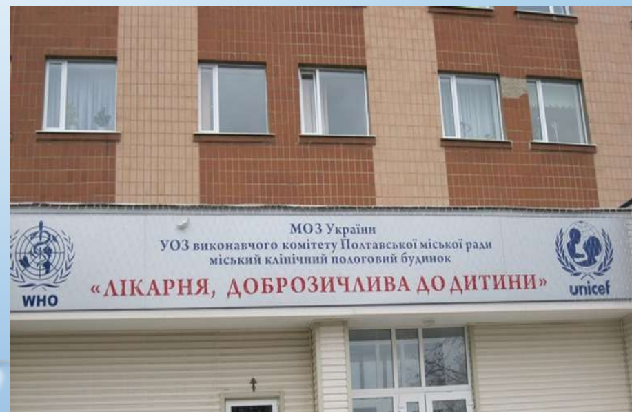
Міський клінічний пологовий будинок