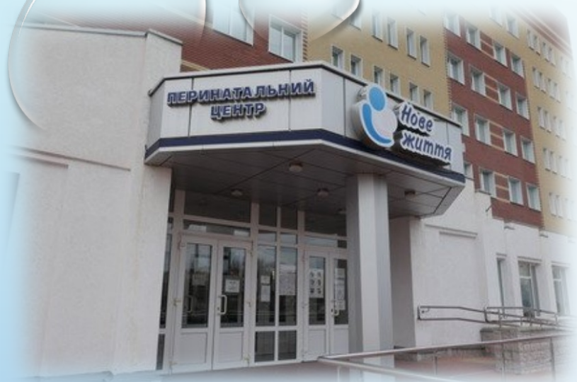
Перинатальний центр КП «ПОКЛ» ім. М.В. Скліфосовського