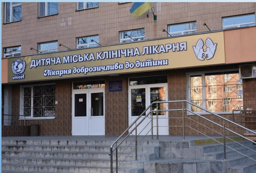
Дитяча міська клінічна лікарня