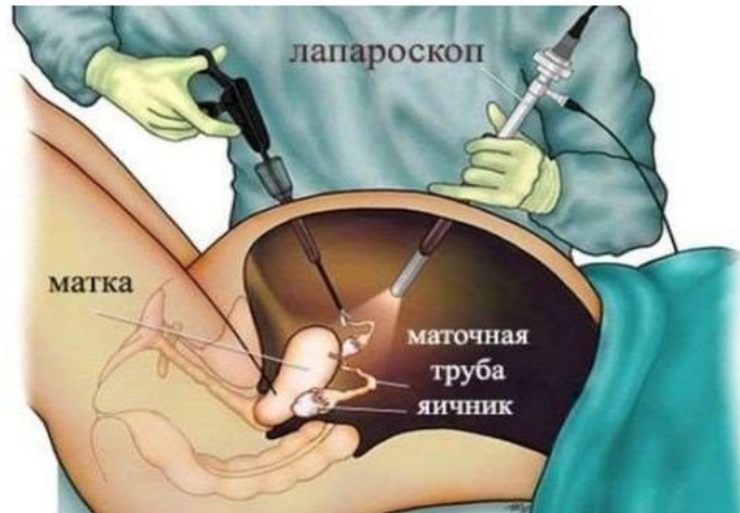
Схематичное изображение проведения лапароскопии

Виконання такого розрізу шкіри і м'язів необхідно для дослідження і подальшого лікування органів черевної порожнини, проводиться лапаротомія і для діагностики проблем, пов'язаних з болями в животі. Як правило, виявлені дефекти або відхилення виправляються під час проведення операції, але іноді потрібно і повторне втручання.