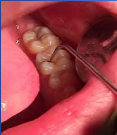
Під час огляду

здобувачі мають можливість проведення основних методів обстеження , встановлення діагнозу та визначення тактики лікування одонтопатології з урахуванням клінічного перебігу