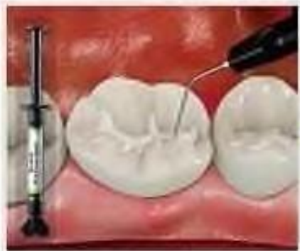
4. Нанесение герметика