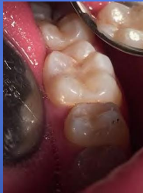
Остаточний результат роботи після полірування