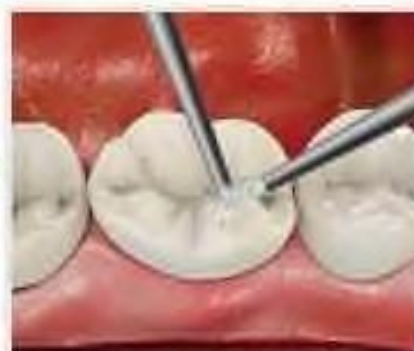
3. Смывание и высушивание