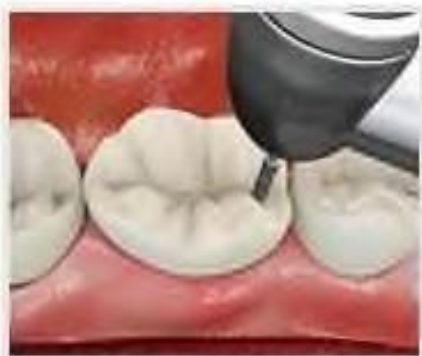
1. Препарирование полости

здобувачі мають можливість оволодіти методикою герметизації фісур для профілактики карієсу